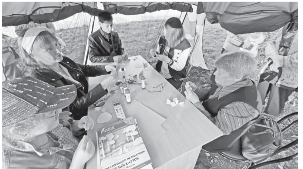
Мастер-класс «Подарок для учителя».

– Музей для меня – это уже часть моей жизни. Это огромный, пока до конца неизведанный мир, хранитель истории. Здесь работают действительно увлечённые и преданные