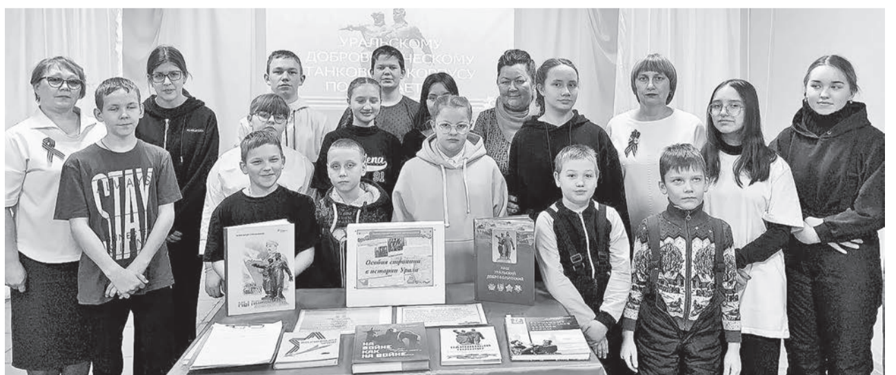
Патриотический час для ребят из подросткового клуба «Кристалл».

В современной России функционируют около 40 тысяч библиотек, в которых работают тысячи квалифицированных библиотекарей. Национальные и федеральные библиотеки относятся к числу мировых информационных гигантов и содержат многомиллионные книжные собрания. Конечно же, крупнейшей публичной библиотекой в стране является Российская государственная библиотека, расположенная в Москве. Это национальная библиотека Российской Федерации, причем крупнейшая публичная библиотека не только в стране, но и одна из крупнейших библиотек мира.