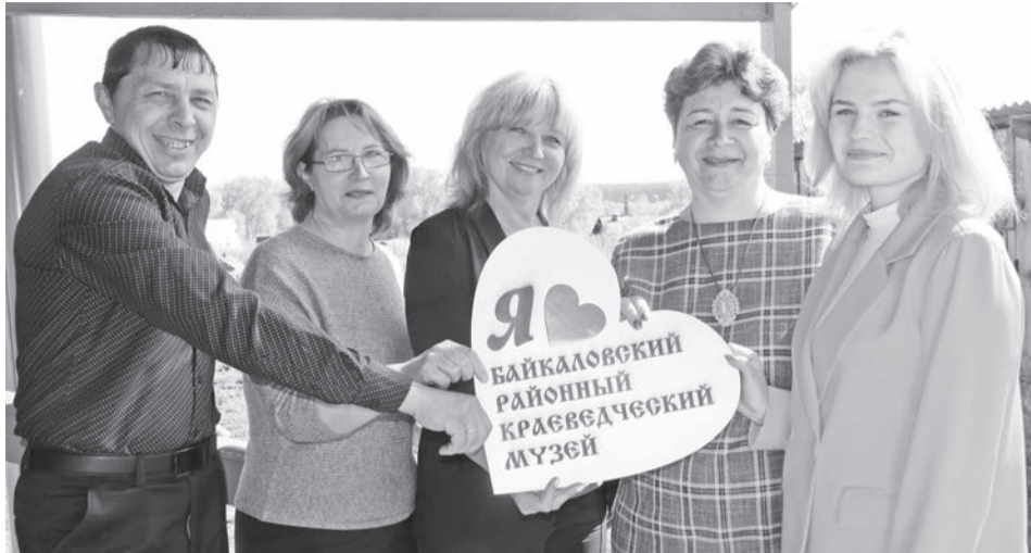
Коллектив районного краеведческого музея.